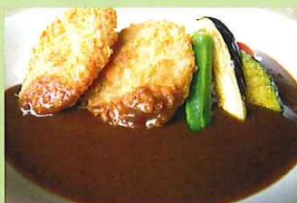
ポークカツカレー ¥1,300